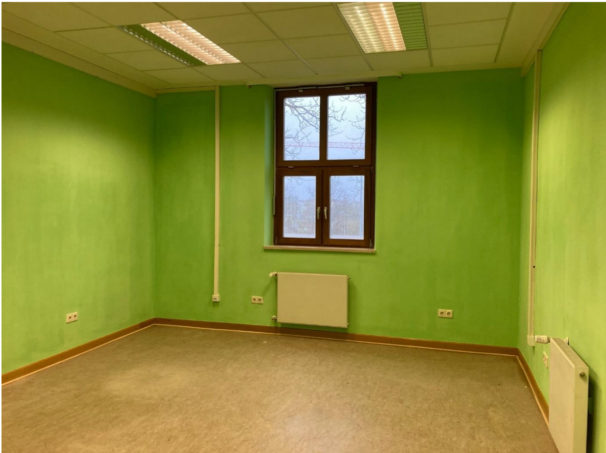
Ein bereits renovierter Raum der Interims-KiTa