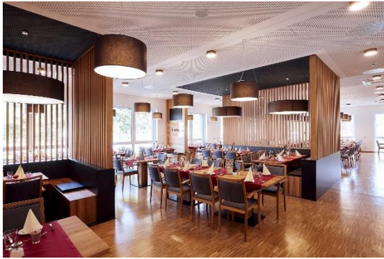
Der gemeinsame Essbereich