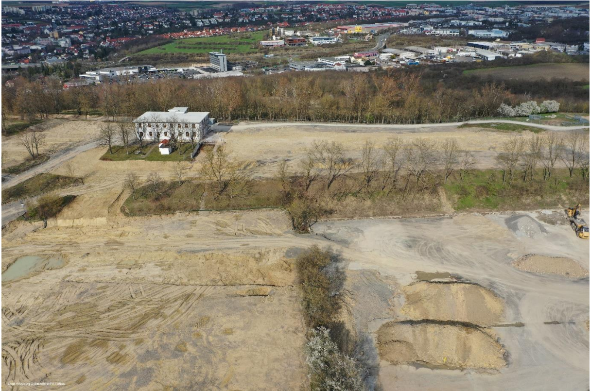
Blick aus der Luft auf die Flugschule