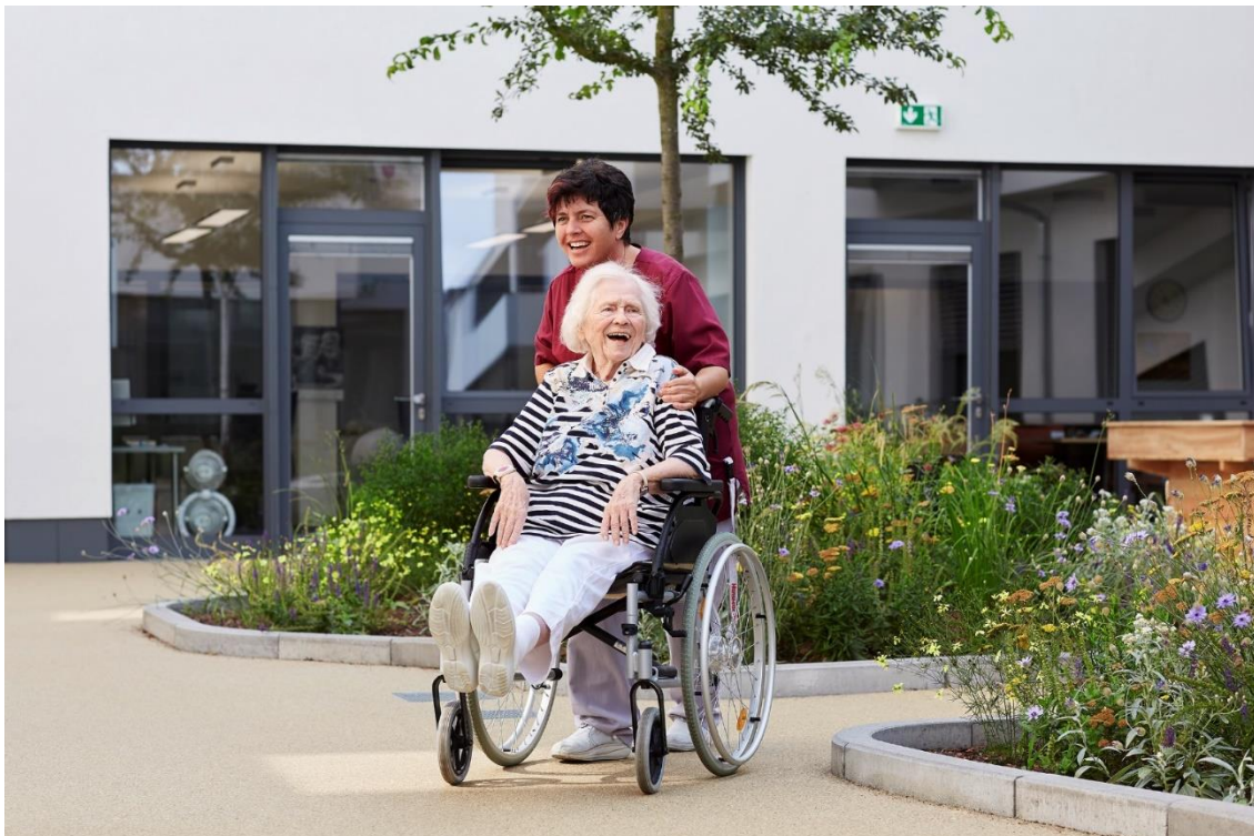
Im Innenhof des Stifts kann ein Stück Natur genossen werden.