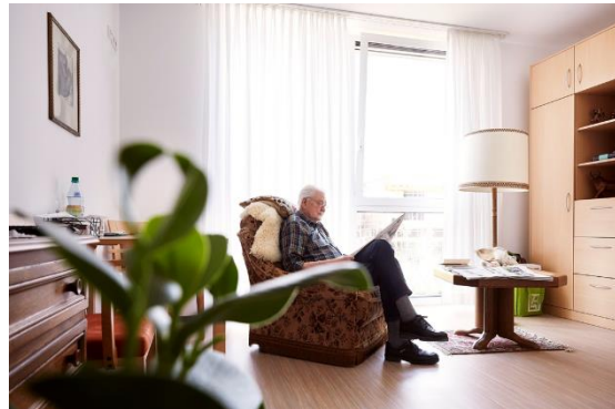
Ein eingerichtetes Pflegezimmer. Auch hier gestalten die Bewohner das Zimmer mit ihren eigenen Möbeln.