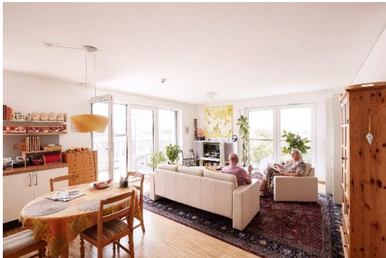
Ein eingerichtetes Appartement. Die Bewohner bringen in der Regel ihre eigenen Möbel mit.